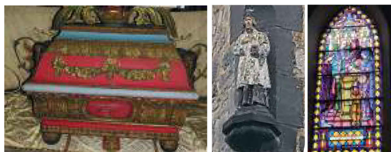
Châsse de saint Walhère (église Saint-Martin de Onhaye) / Walhère patron des animaux / Vitraux de l'église Saint-Martin: baptême à Bouvignes.