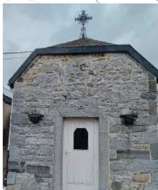
Chapelle du Bonair

Surplombant la route depuis la petite colline où elle se dresse, c'est à l'église de Onhaye que commence notre visite. Datant du XVIIe siècle, elle est dédiée à saint Martin, malgré le culte au saint local auquel elle semble vouée. Les six vitraux de la nef latérale gauche retracent la vie de Walhère. On peut y voir: « son baptême à Bouvignes, sa nomination comme curé à Onhaye puis comme doyen du Concile de Florennes, sa visite au vicaire de l'église voisine d'Hastière et l'épisode tragique du coup de rame asséné par ledit